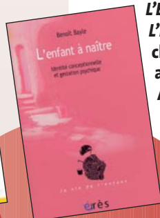
L'enfant à naître Identité conceptuelle et gestation psychique Benoît Bayle Éditions Érès, 2005